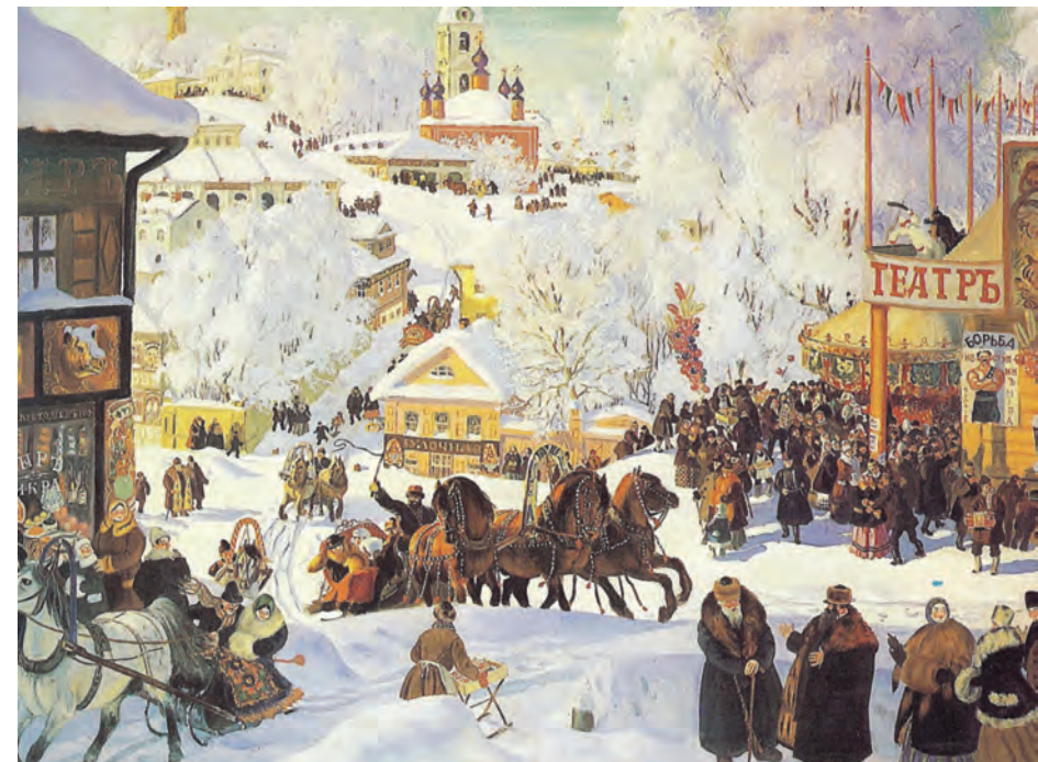
Б. Кытòдиев. Зима, 1919.